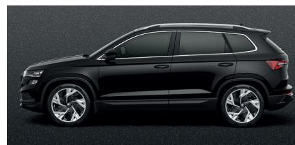
Metalo blizgesio juoda „Magic black“ – 540 € „SportLine“ – 180 €