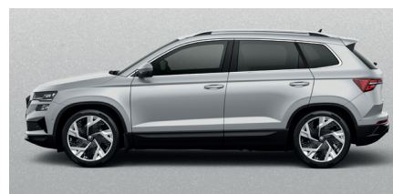
Metalo blizgesio pilka „Brilliant silver“ – 540 € „SportLine“ – 180 €