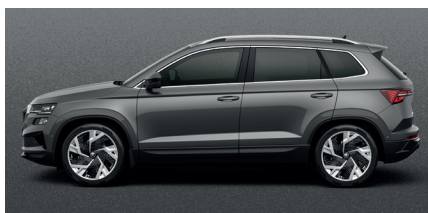
Metalo blizgesio pilka „Graphite grey“ – 540 € „SportLine“ – 180 €