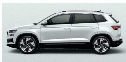
Metalo blizgesio balta „Moon white“ – 540 € „SportLine“ – 180 €