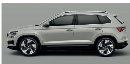
Speciali pilka „Steel grey“ – 360 € „SportLine“ – 0 €