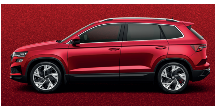
Metalo blizgesio raudona „Velvet red“ – 890 € „SportLine“ – 540 €