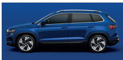
Paprasta mėlyna „Energy blue“ – 0 €