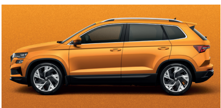
Metalo blizgesio oranžinė „Phoenix orange“ – 890 € „SportLine“ – 540 €