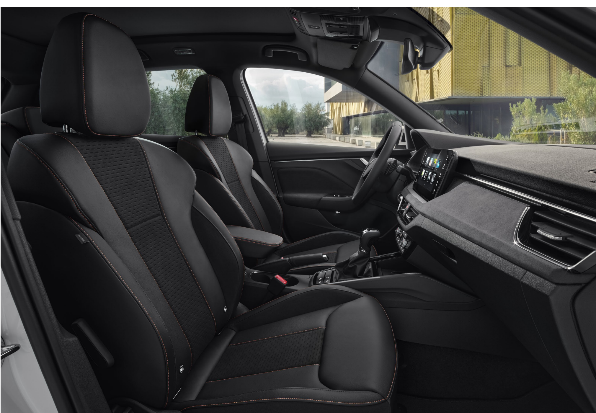
Interjeras „Monte Carlo“