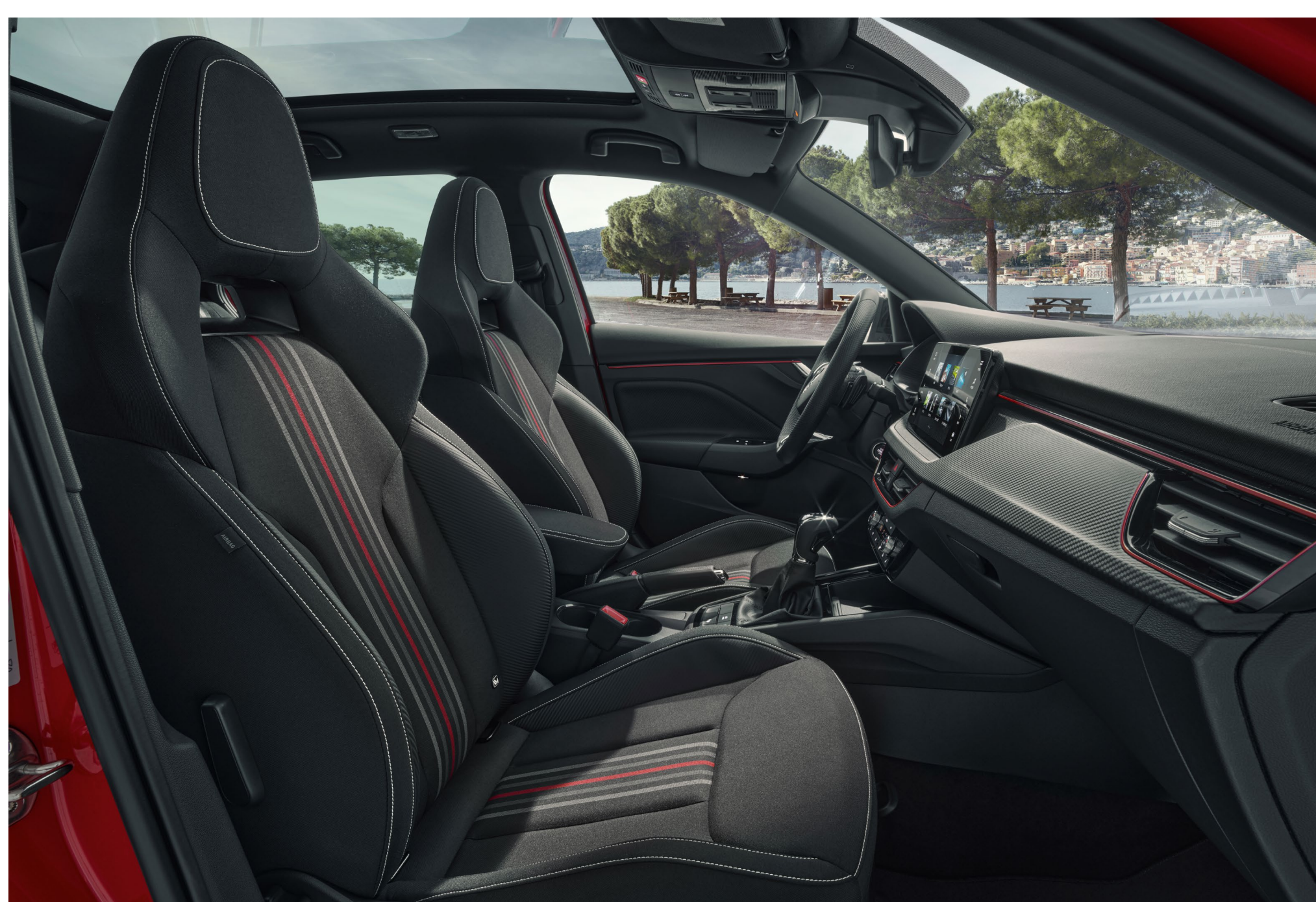
Interjeras „Monte Carlo“