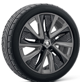
17 colių „Procyon“ lengvojo lydinio ratlankiai, metalo blizgesio pilkos spalvos, su juodais aerodinaminiais gaubtais (PX7)