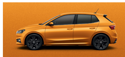
Metalo blizgesio oranžinė „Phoenix Orange“ – 760 € *

* - kaina skiriasi Monte Carlo apdailos lygįje.