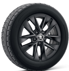
15 colių „Rotare“ lengvojo lydinio ratlankiai, metalo blizgesio juodos spalvos (PJ3)