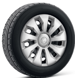
15 colių plieniniai ratlankiai su „Calisto“ gaubtais (PJ1) – „Active“ standartinė įranga