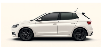
Paprasta balta „Candy White“ – 290 €