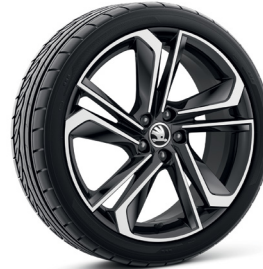
18 colių blizgūs juodi „Libra“ lengvojo lydinio ratlankiai (PJF)