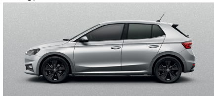
Metalo blizgesio pilka „Brilliant Silver“ – 420 €