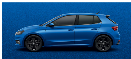
Metalo blizgesio mėlyna „Race Blue“ – 420 €