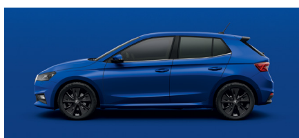
Paprasta mėlyna „Energy Blue“ – 0 €