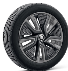
16 colių „Proxima“ metalo blizgesio pilkos spalvos lengvojo lydinio ratlankiai su juodais aerodinaminiais gaubtais (PJ6)