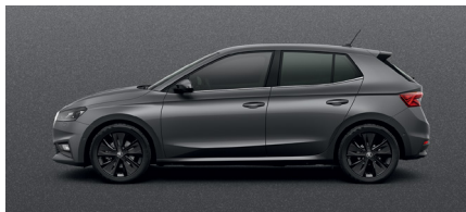
Metalo blizgesio pilka „Graphite Grey“ – 420 €