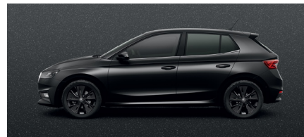
Metalo blizgesio juoda „Magic Black“ – 420 €