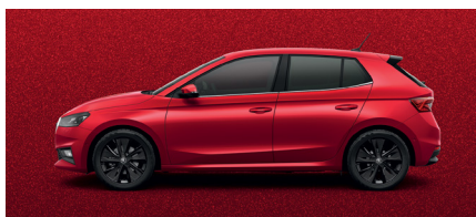
Metalo blizgesio raudona „Velvet Red“ – 760 € *