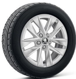
15 colių sidabriniai „Rotare“ lengvojo lydinio ratlankiai (PJ2) – „Ambition“ ir „Elegance“ standartinė įranga