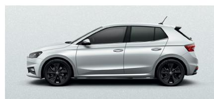
Metalo blizgesio balta „Moon White“ – 420 €