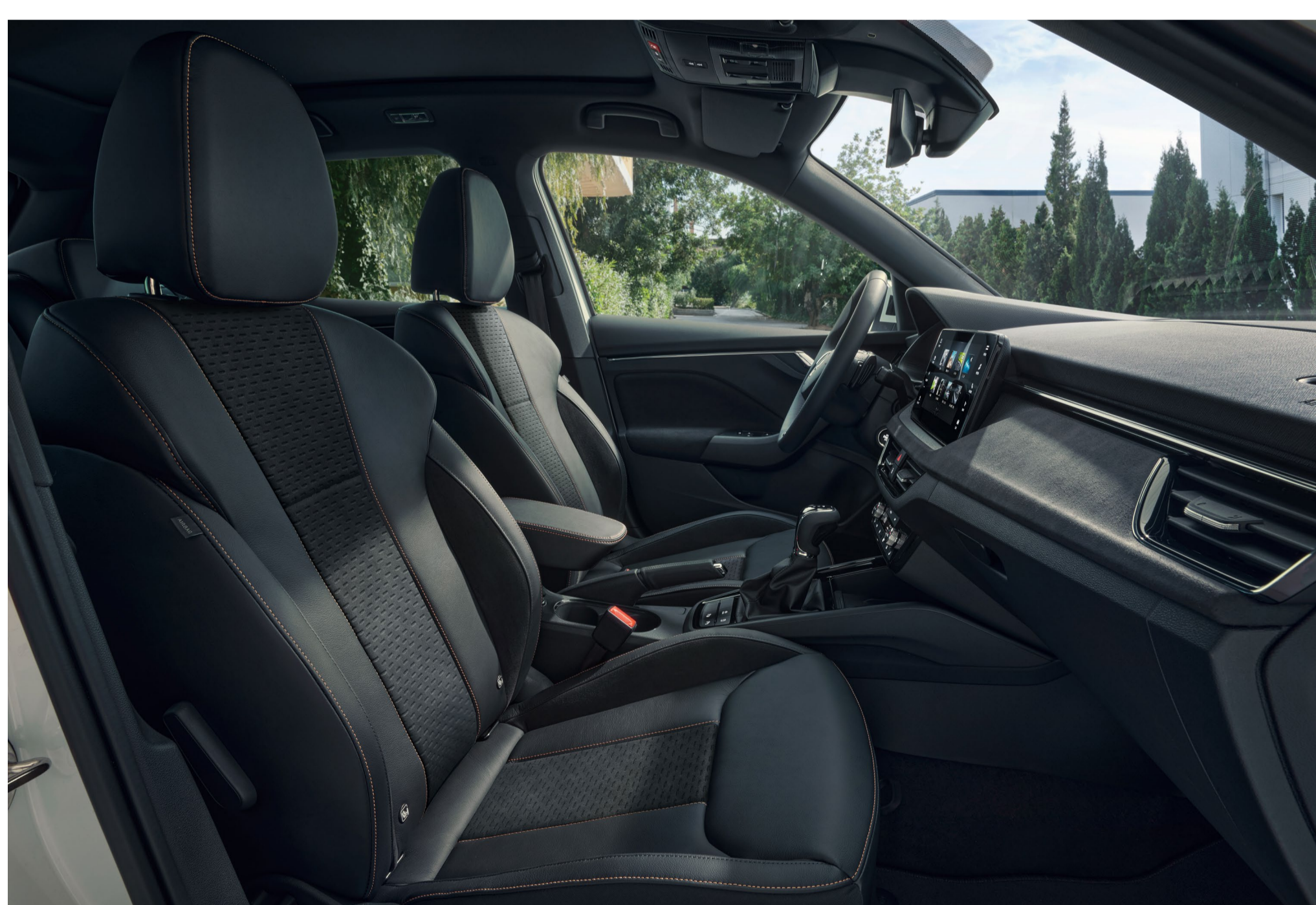
Interjeras „Monte Carlo“